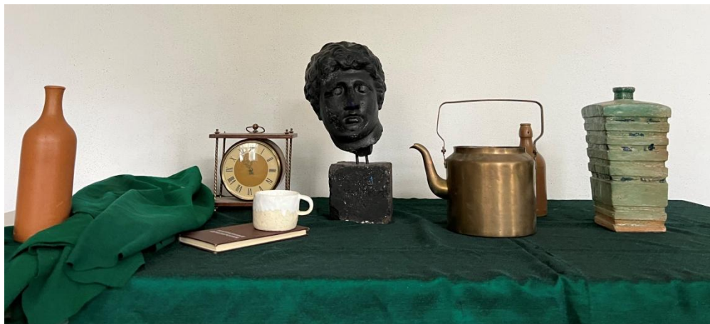
Пример экзаменационной постановки